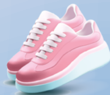
Chaussures attachées par paires