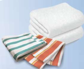
Linge de maison